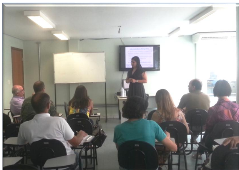
Curso de Capacitação para elaboração do Plano Plurianual de Aplicação –PPA PS1 19/11/2015